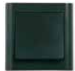
LK FUGA Softline®. 63 mm bred. Hvid, lysegrå, hvid/stålm metallic, koksgrå/stålm metallic og koksgrå.