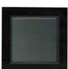
LK FUGA Hardline® Deco. 68 mm bred, 2,5 mm tyk front i glasklar, pastelblå, lyserød, dybrød, sort, hvid samt børstet stål og poleret messing