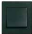
LK FUGA Baseline®. 68 mm bred. Hvid, lysegrå og koksgrå.