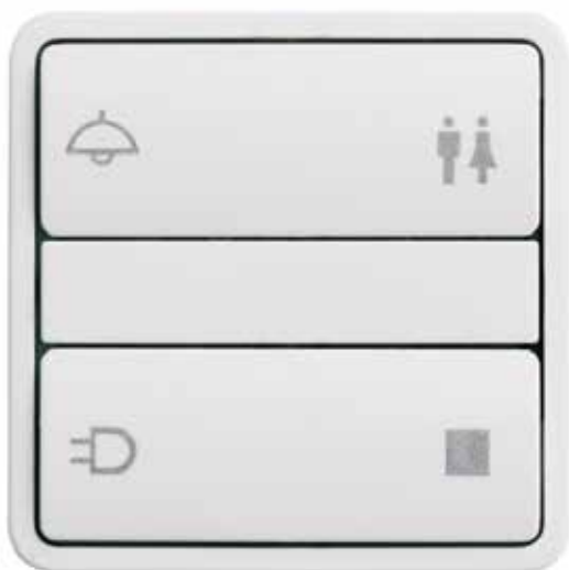
◀ LK FUGA® betjeningstryk i hvid med 50 mm Baseline ramme.

Ønsker du at vide mere om IHC, kan du rekvirere separate brochurer via www.lk.dk .