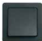
LK FUGA Baseline®. 63 mm bred. Hvid, lysegrå og koksgrå.