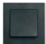
LK FUGA Hardline®. 68 mm bred. Hvid, lysegrå, hvid/stålm metallic, koksgrå/stålm metallic og koksgrå